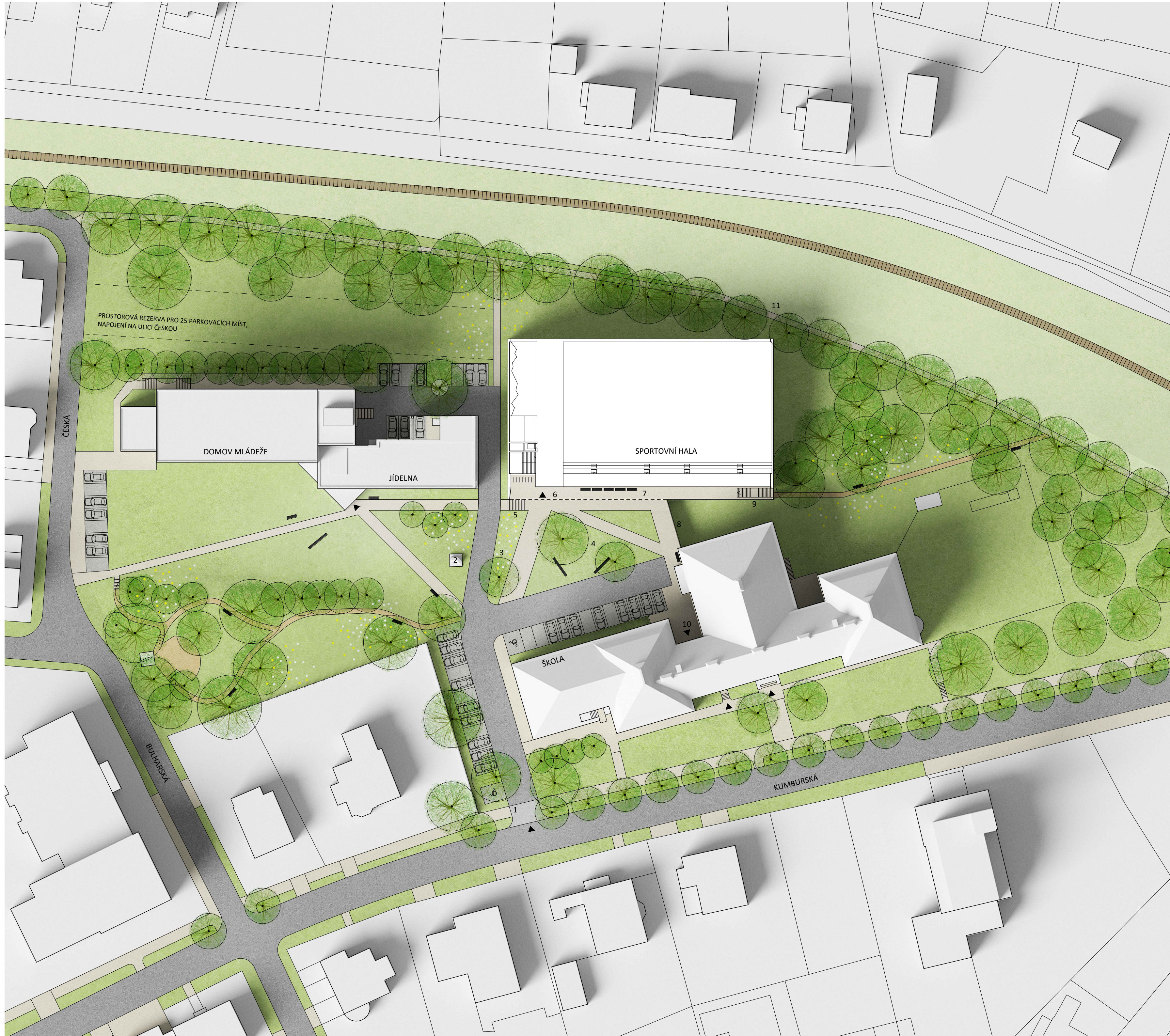
ARCHITEKTONICKÁ SITUACE 1:500