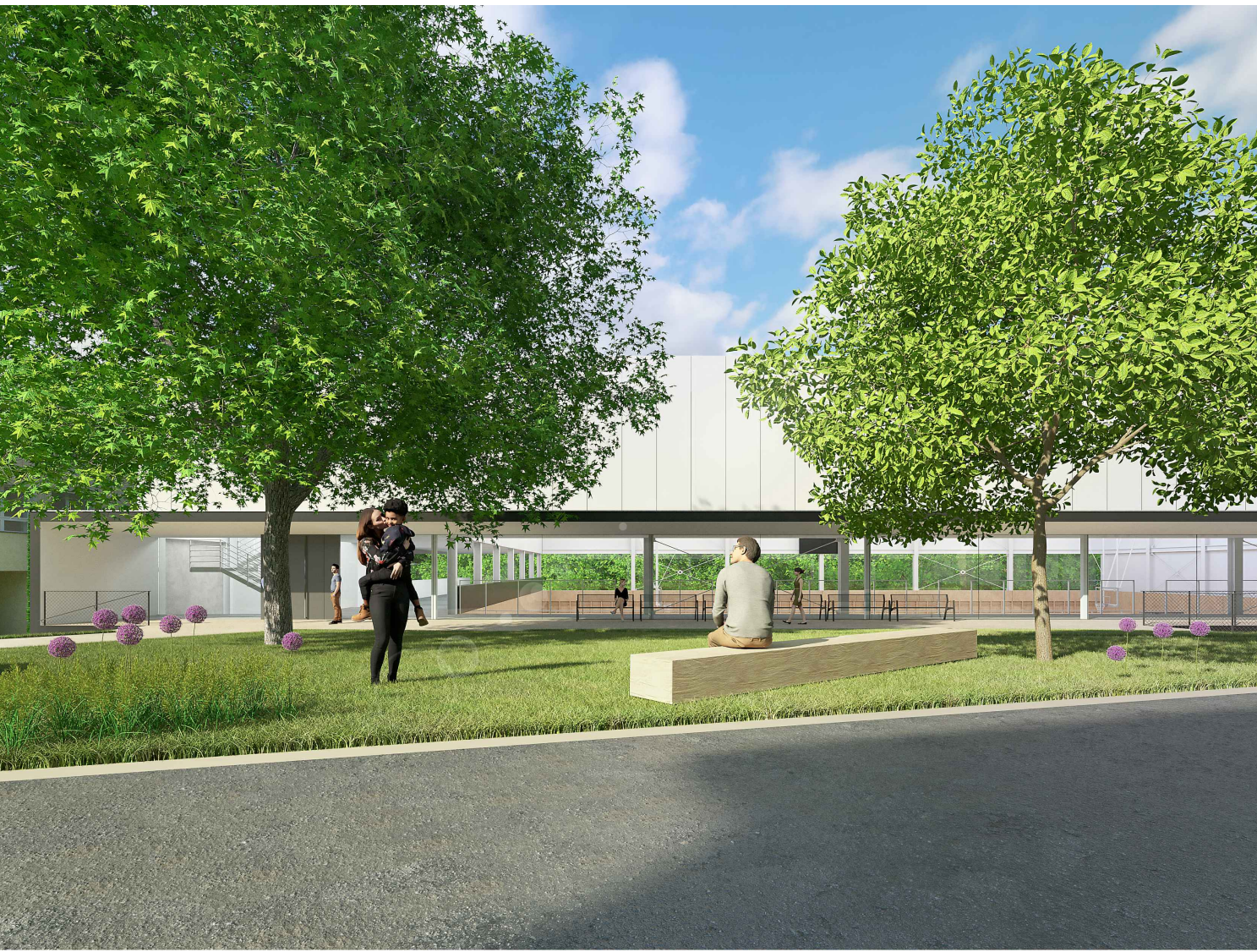
PERSPEKTIVA S OKNEM TĚLOCVIČNY