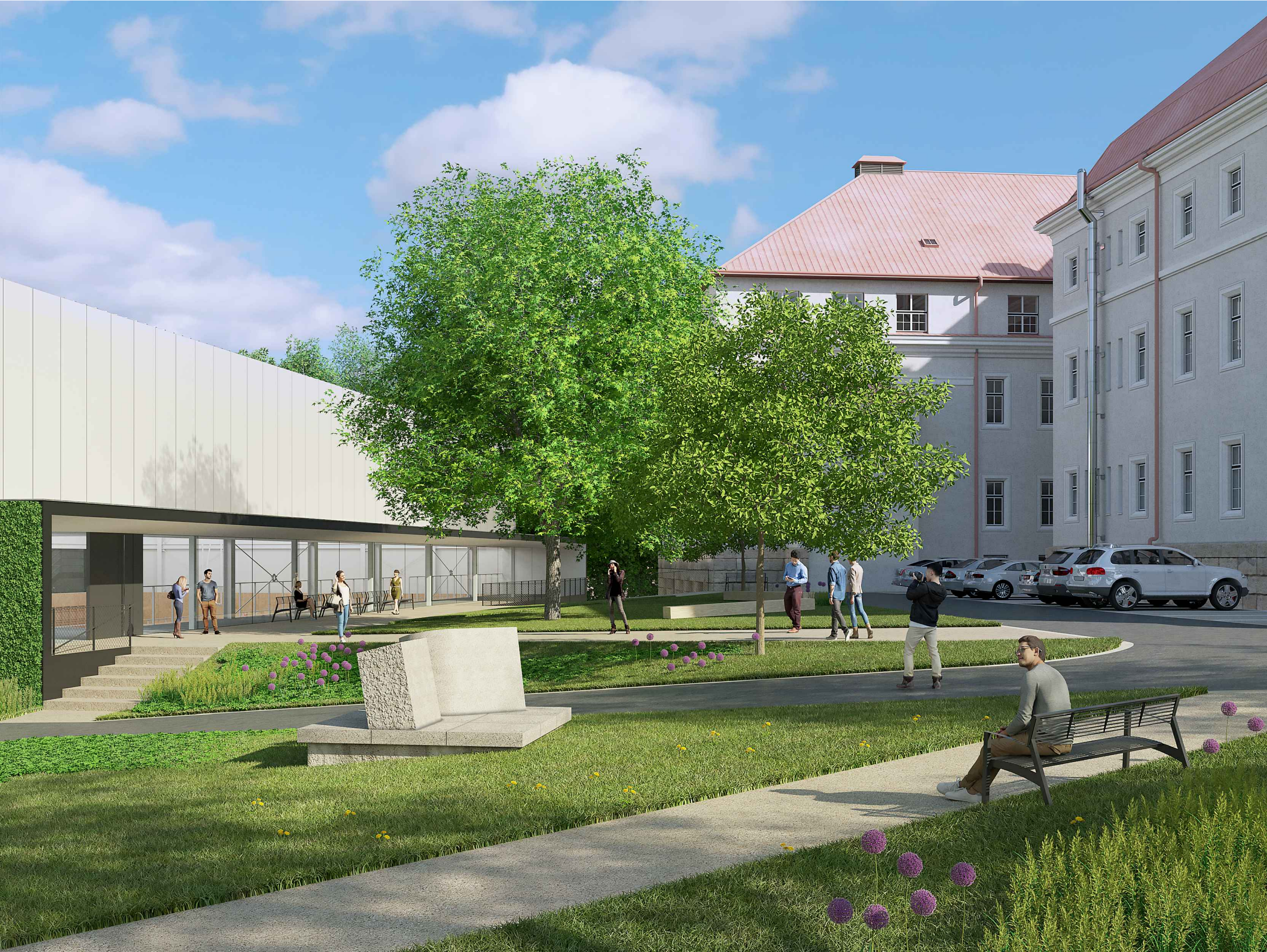
PERSPEKTIVA EXTERIÉRU S POHLEDEM NA VSTUP